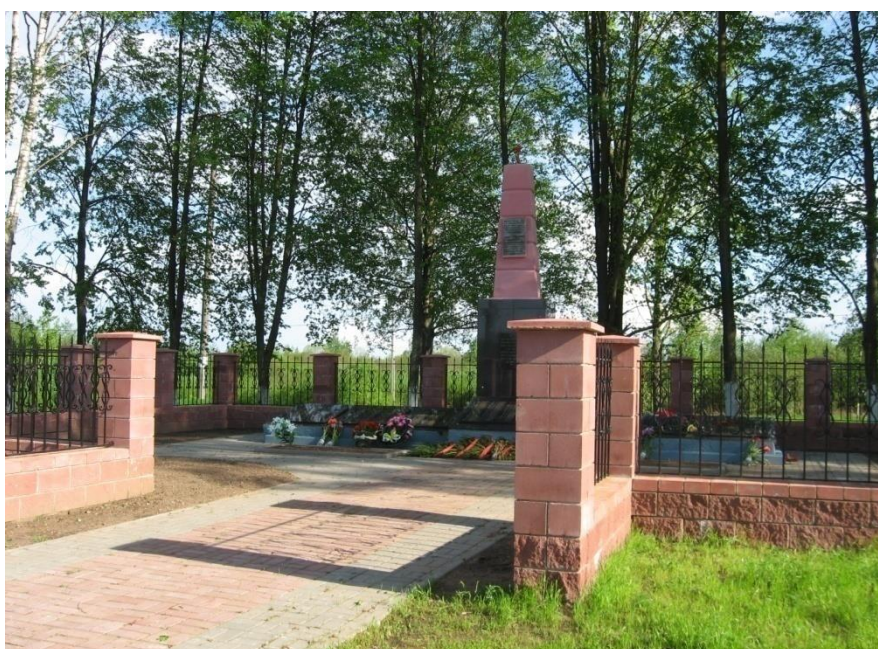
Памятник на братском кладбище советских воинов-освободителей в агрогородке